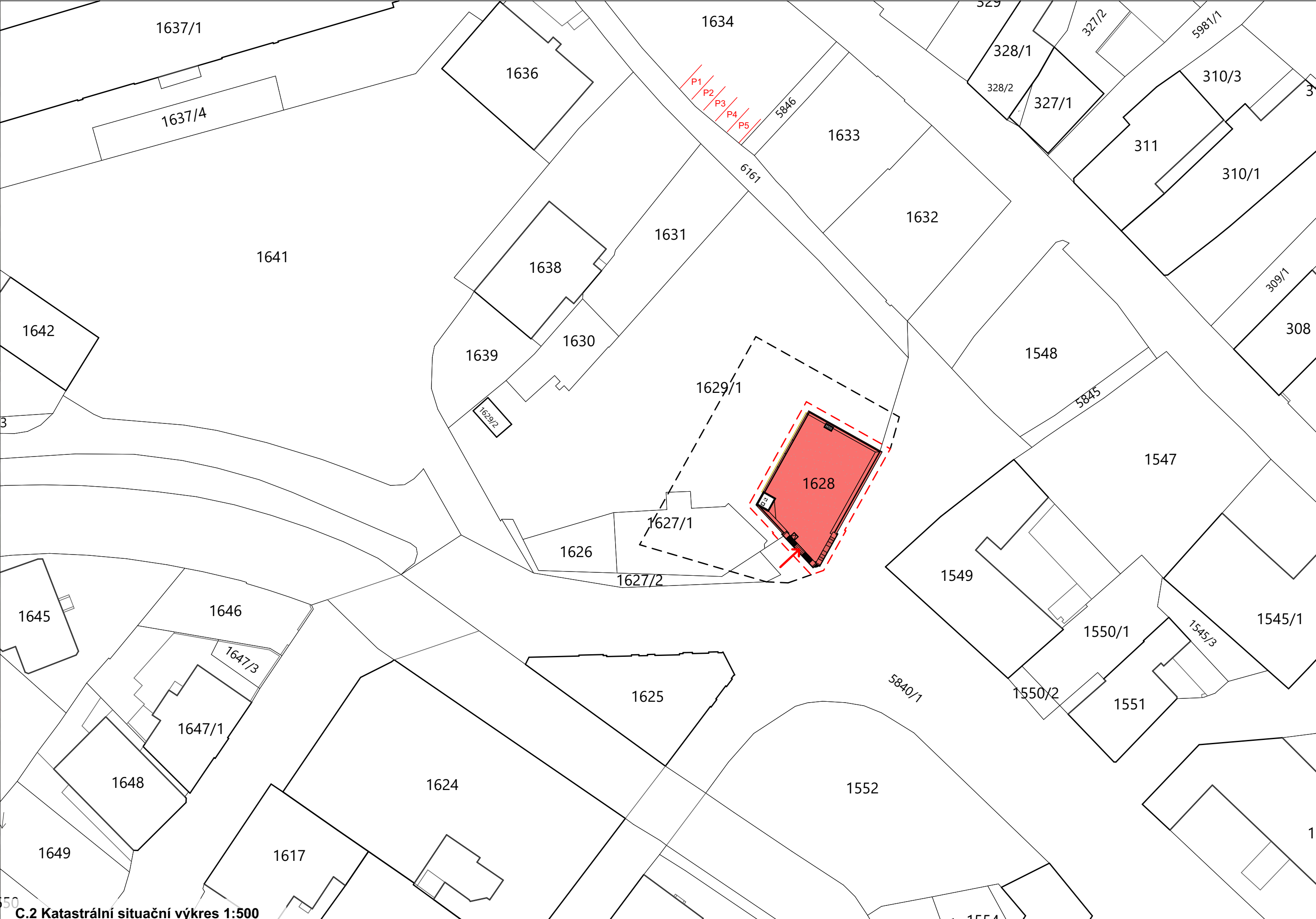
C.2 Katastrální situační výkres 1:500