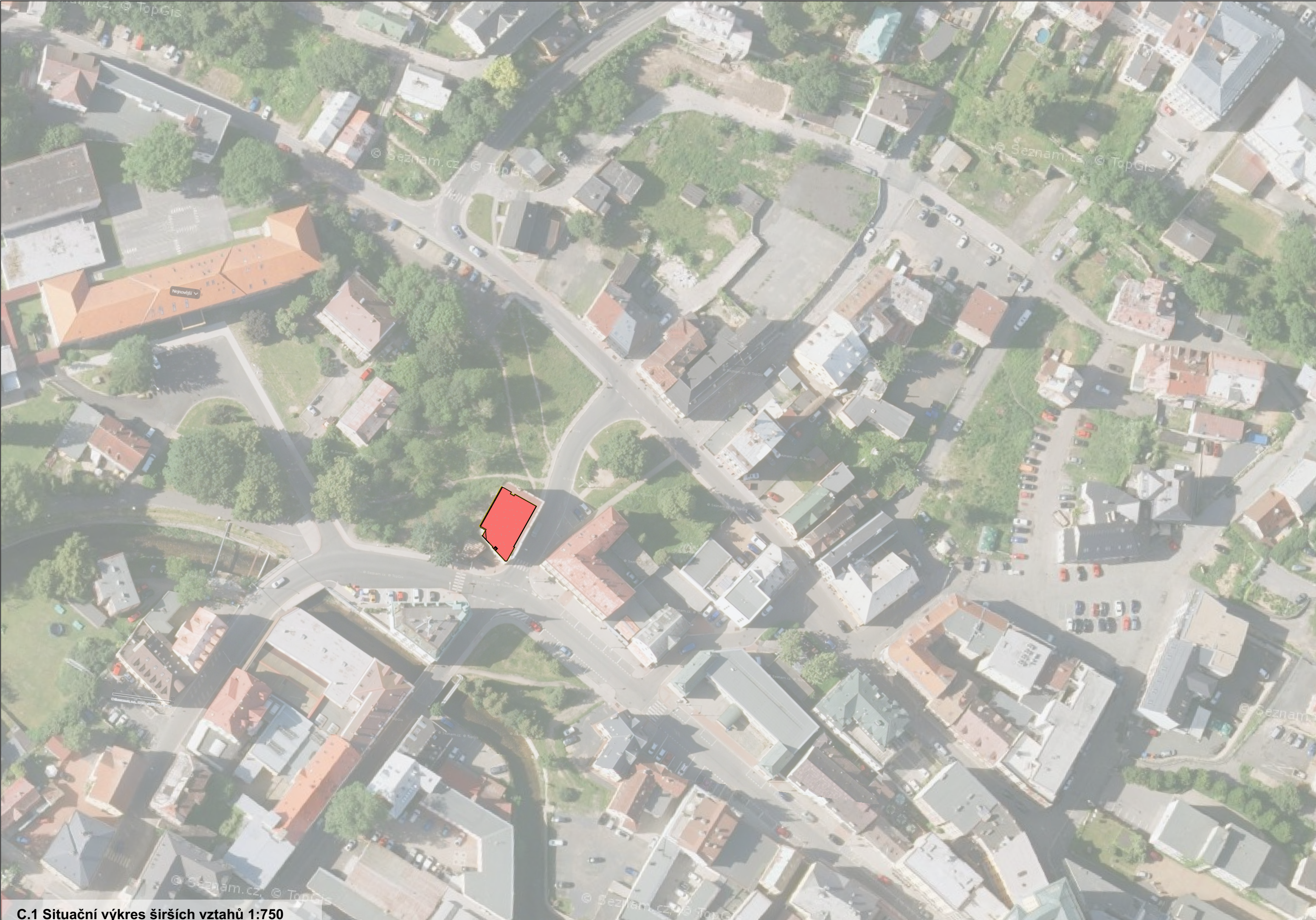
C.1 Situační výkres širších vztahů 1:750